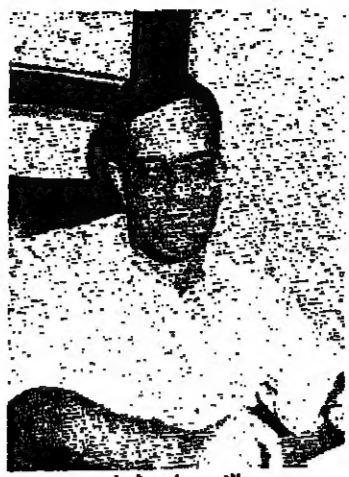
الامير وليد شهاب

كتبت ليانا كرم: الاقساط المدرسية التي توكب الاعداد الدراسية سنة بعد سنة، هي مشكلة صعبة الحل بالنسبة الى ذوي الطلاب من جهة، واصحاب المدارس الخاصة من جهة ثانية، فالاقساط المدرسية التي تفرض في يدك من سنة، مفتوحة على الزيادات التي تطرا سنويا على غلاء المعيشة، وهي زيادات تنحصر سلبا على رواتب المعلمين والنفقات العامة التي تتصلها ادارة المدارس، بالإضافة الى الازياح السنوية التي تجتثها المدارس من اقساط طلابها. والاهم من ذلك الصرخة التي يطلقها المسؤولون عن المدارس الخاصة بعد كل زيادة تفرضها الدولة على غلاء المعيشة، صرخة ادارات المدارس ترتفع على الزيادة في رواتب المعلمين بنسبة الزيادة على غلاء المعيشة، وهي زيادة لا تستطيع المدارس فرضها على اولياء الطلبة في مستقبل السنة الدراسية، تتعود فقرضاها في منتصف العام الدراسي، اي بعد تحديدها من قبل الدولة، واذا رفضت المدارس اضافة الزيادة على الاقساط المدرسية، وقعت في الحيز المالي في موازنتها السنوية. فاي